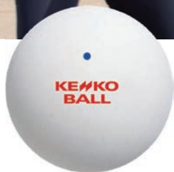
Soft-tennis ball ケンコーソフトテニスボール (公財)日本ソフトテニス連盟公認球