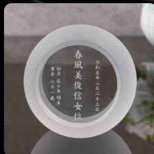
メモリアルクリスタル