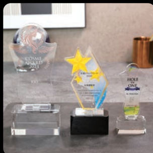
プレミアム アクリルシリーズ