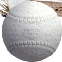
Baseball ケンコーボール (公財)全日本軟式野球連盟公認球