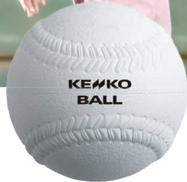
Softball ケンコーソフトボール (公財)日本ソフトボール協会検定球