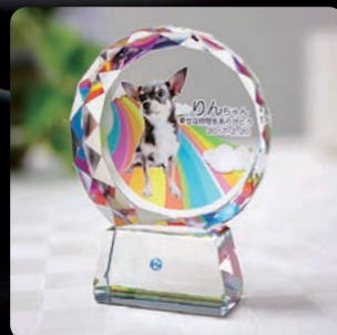
ペットメモリアル