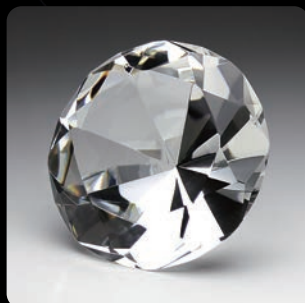
クリスタル ペーパーウェイト