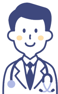
医師による スポーツ医事相談

その方に合った運動内容と運動量、実施上の留意点などを医学的な面からアドバイスをします