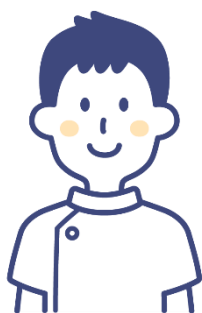
理学療法士による スポーツ医事相談

その方に合った運動内容と運動量、実施上の留意点などを医学的な面からアドバイスをします