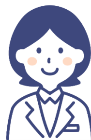
【オンライン相談可能】 管理栄養士による 栄養相談

健康な生活を送るためのバランスのいい食事やスポーツを行う上で効果的な栄養摂取などをアドバイスします