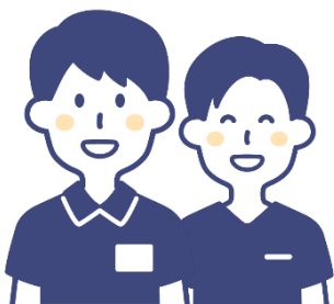
スタッフによる運動相談

ご利用が初めての方や運動内容の見直しをしたいかなどを対象に、センターやご自宅で行えるスポーツ活動を一緒に考えます