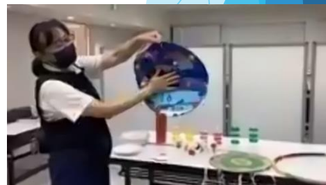
(昨年度のセミナーより) フライングディスク競技を通じた インクルーシブ教育の方法