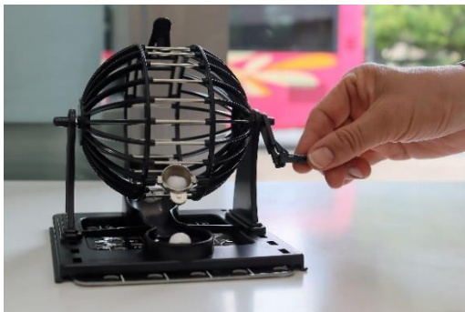
抽選はくじ引きでおこなっています