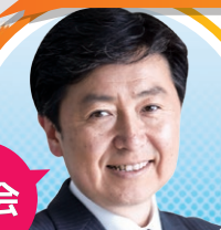
フリーアナウンサー 笠井信輔さん