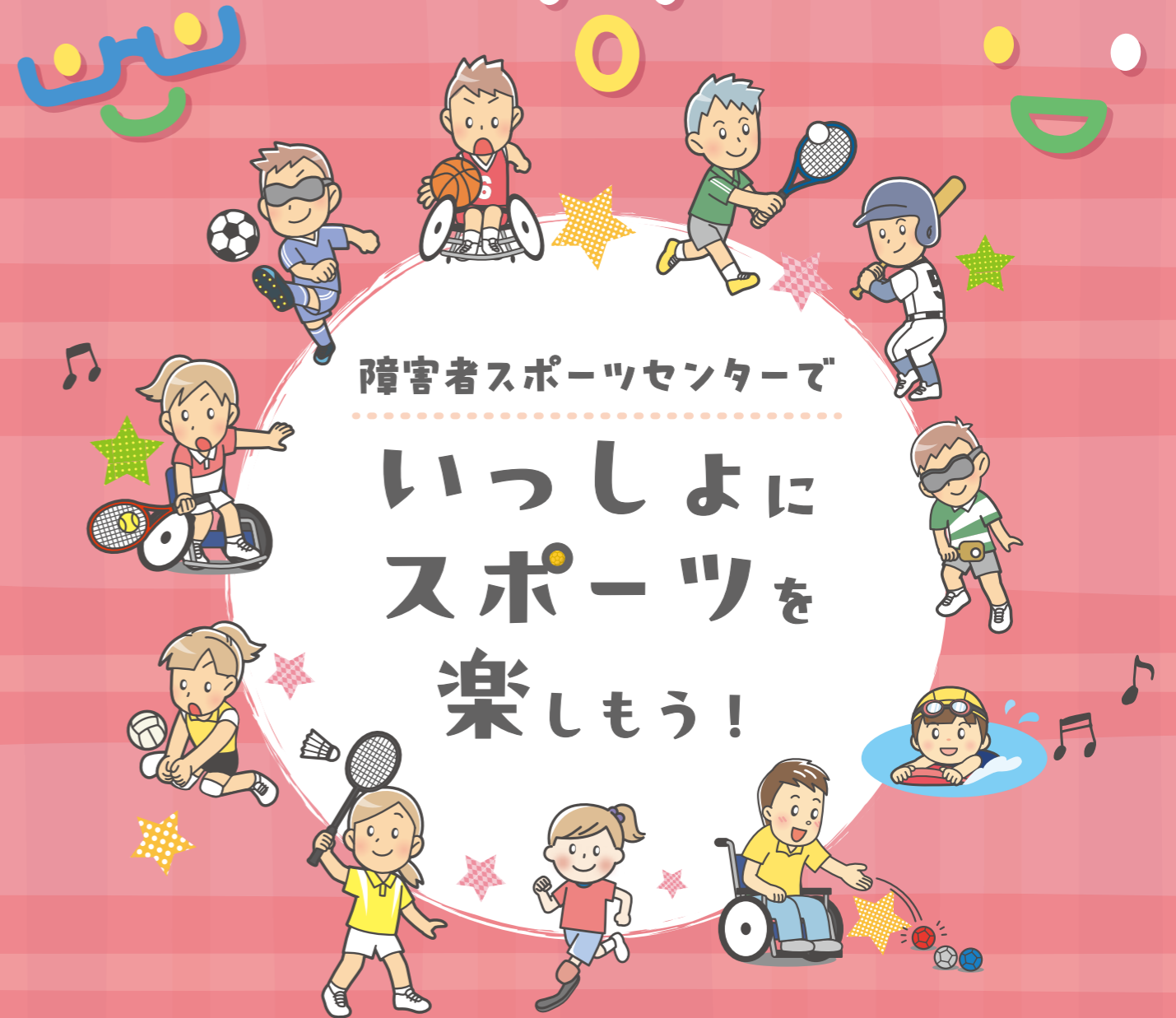
東京都障害者総合スポーツセンター