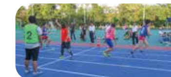
はばたき陸上大会(総合)