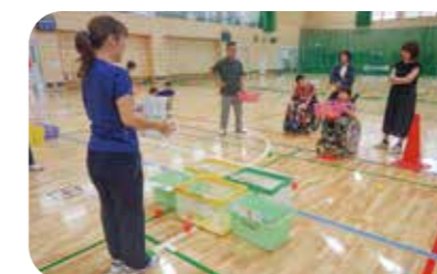
ジュニア対象教室(多摩)