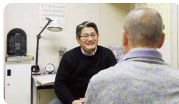
医師による健康スポーツ相談

初めてセンターで運動を実施しようとしている方や、健康・体力の維持増進、競技力向上のためのトレーニング方法を知りたい方などに対して、スポーツスタッフが様々な運動についての相談に応じます。