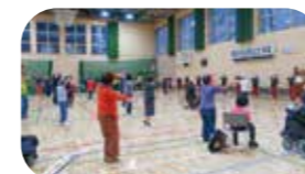
地域交流事業【障害者週間記念事業】(多摩)

どなたでも楽しく参加できるスポーツ体験やイベントを実施しています。ご家族やお友達をお誘いのうえ、お越しください。