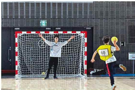
「競技体験会」デフハンドボール