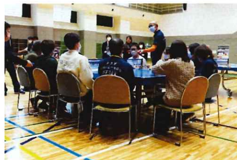
医療・福祉関係者等対象