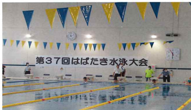
【第37回はばたき水泳大会】