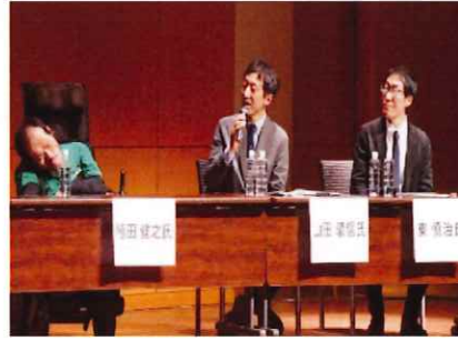
障害者スポーツフォーラム 分科会1（会場の様子）