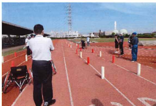
スラローム審判員講習