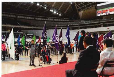
都民体育大会と選手宣誓