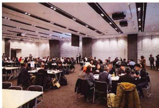
企業×障害者スポーツ競技団体等の交流会 2023