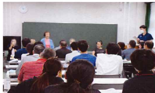
初級パラスポーツ指導員養成講習会