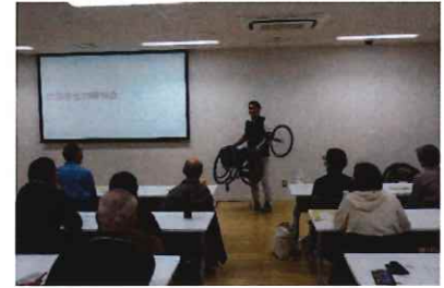
エスフォルタアリーナ八王子