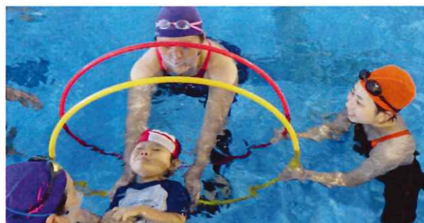
【重度障害者のためのプールひろば】