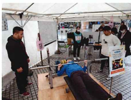
パラ・パワーリフティング体験（府中市）