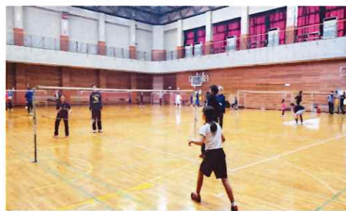
みんなで交流☆バドミントン (東大和)