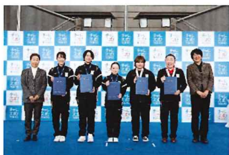
ステージプログラム