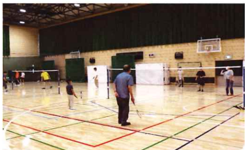
みんなで交流☆バドミントン