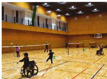
バドミントン教室