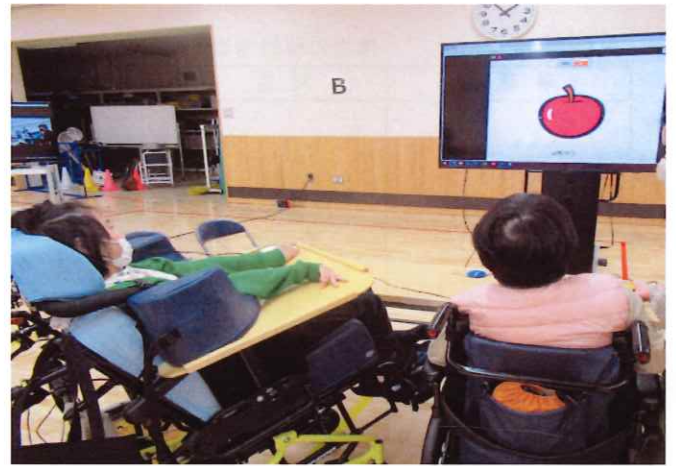
【はじめよう！eスポーツ体験】