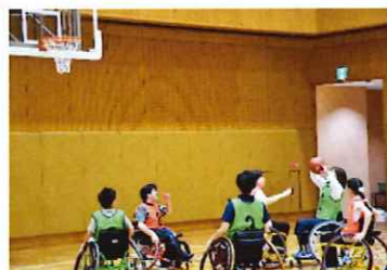
車いすバスケットボール