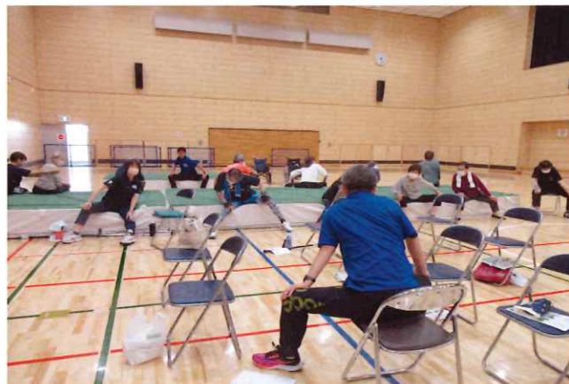
【理学療法士による介護予防体操】