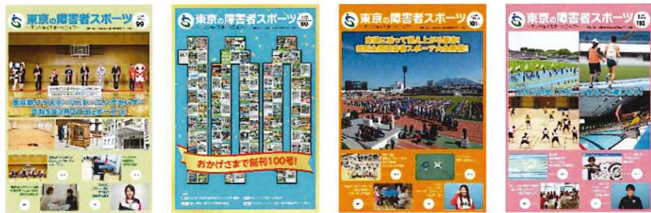
広報誌『東京の障害者スポーツ』99号～102号