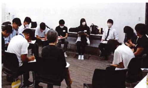
第1回地域ブロック関係者連絡会議