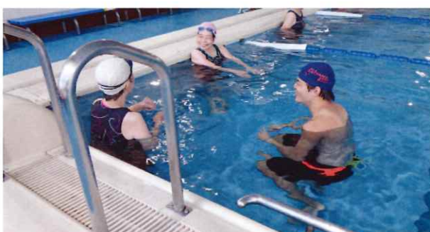
【ワンポイント水泳】