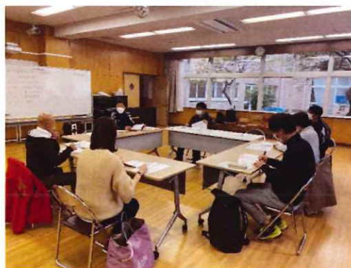
杉並区教育委員会 済美教室「ボッチャ体験会」