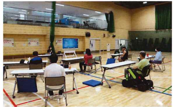
脳血管障害者の運動教室