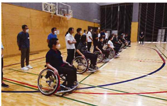
各障がい者の理解（肢体不自由①）