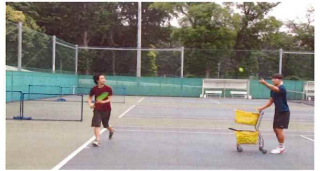
【スポーツオリエンテーション教室～ラケットスポーツ編～】