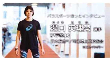
第24回日本パラスポーツ選手権大会 女子161 会場：東京 競技の記録はこちら▶