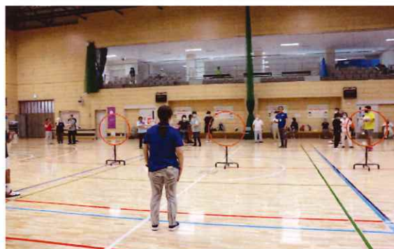
ブラインドスポーツ体験