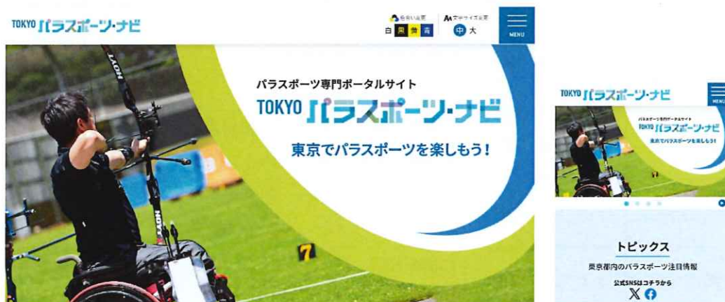
TOKYO パラスポーツ・ナビ トップページ（パソコン版／スマートフォン版）

写真やイラストを用いて、より見やすく、分かりやすいデザインに刷新し、必要な情報が入手しやすくなりました。今後はイベント情報やスポーツ施設、クラブ団体情報などの充実化を図るとともに、新たに設けた「トピックス」コーナーで東京都内の障害者スポーツ情報を積極的に発信しました。