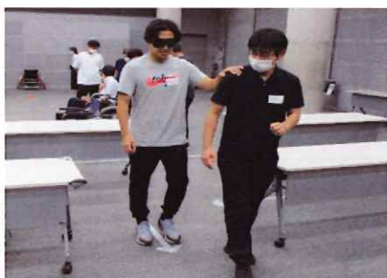
視覚障害者誘導体験