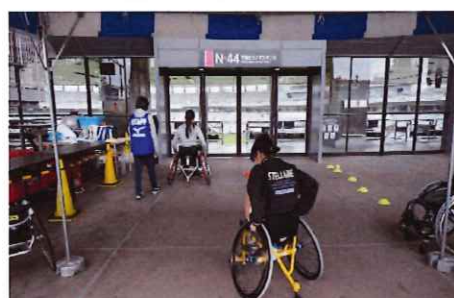
障害者スポーツ用具の貸与事業 第41回調布市民スポーツまつり