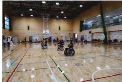
全国障害者スポーツ大会競技の 指導法と競技規則 (実技：車いすバスケットボール)