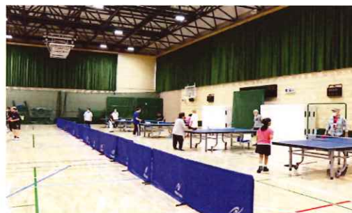
みんなで交流☆卓球