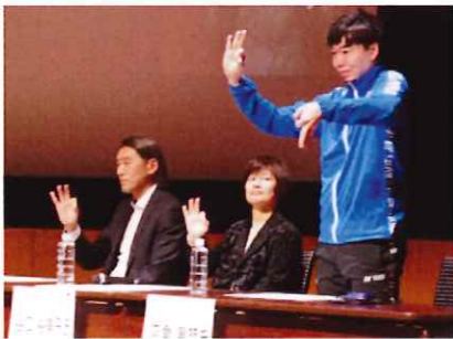
シンポジウム（会場の様子）