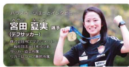
2022年東京パラリンピック女子サッカー日本代表 第20回全日本パラリンピック競技大会 トレーニングセンター 2023年東京パラリンピック女子サッカー日本代表 競技の記録はこちら▶