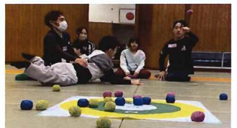
日常利用促進サポート