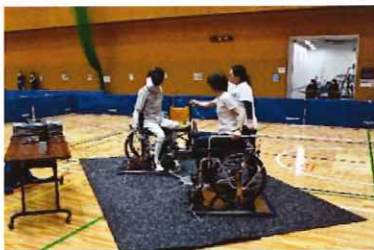
車いすフェンシング