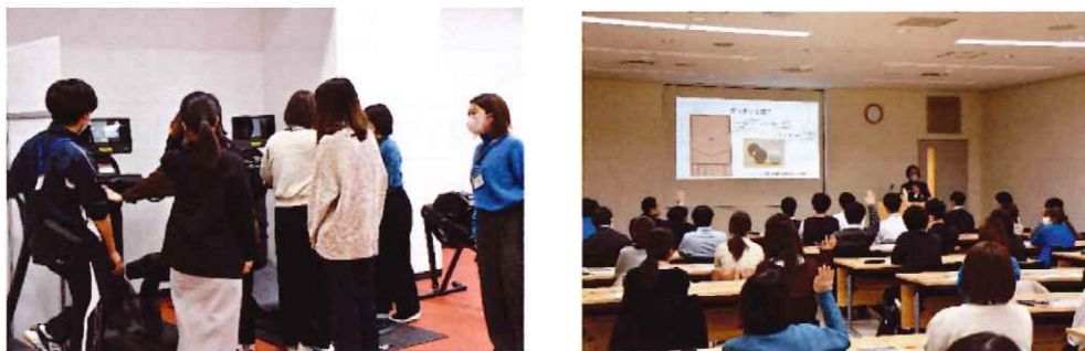
パッケージプラン（調布市）