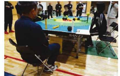
最重度の障がい者 スポーツの実施