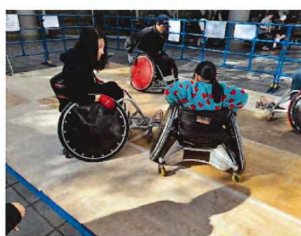
車いすラグビー体験（目黒区）