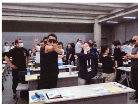
利用促進マニュアル内容紹介