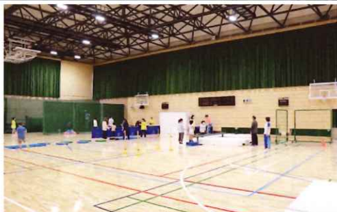
GOGO親子で運動タイム