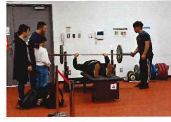
パラ・パワーリフティング