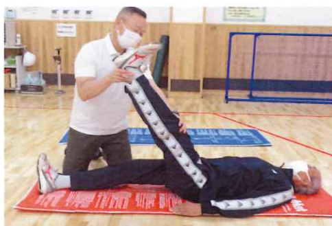
【パラスポーツトレーナーによるサポート(個人向け)】