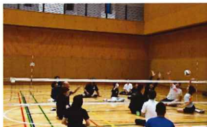
シッティングバレーボール