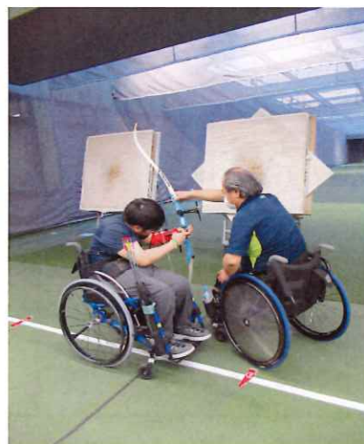
【はじめよう！アーチェリー入門】