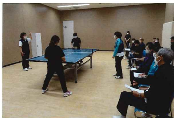
サウンドテーブルテニス審判員フォローアップ