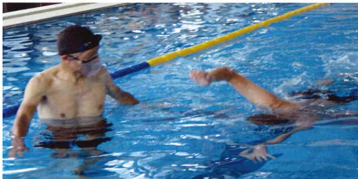
【はじめよう！水泳入門】