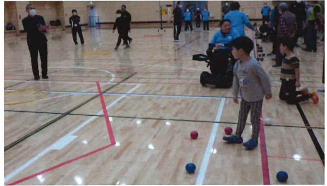
【みんなで交流☆ポッチャ】