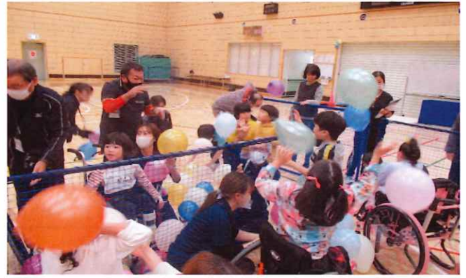
【第3回わくわく運動会】