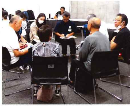
リ・スタート研修会 グループディスカッション