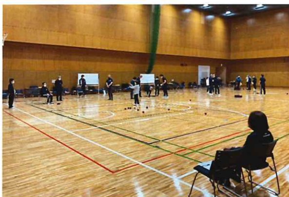
ボッチャ審判員フォローアップ