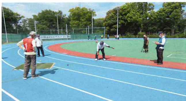
【第30回はばたきグラウンド・ゴルフ大会】