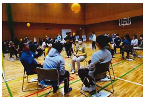
区市町村スポーツ推進委員等対象