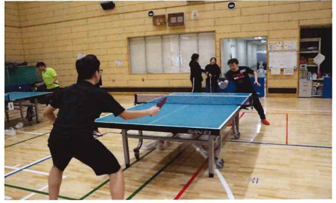
【みんなで交流☆卓球】