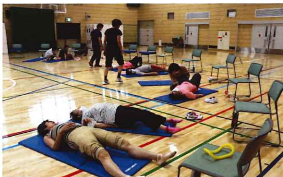
お手軽・簡単エクササイズ