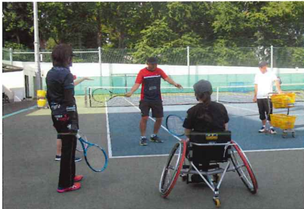
【みんなで交流☆テニス】