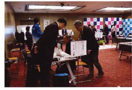
相談会（会場の様子）