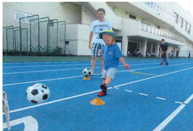
【ジュニアわくわくスポーツ教室】