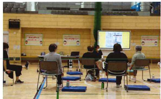
変形性関節症の運動教室