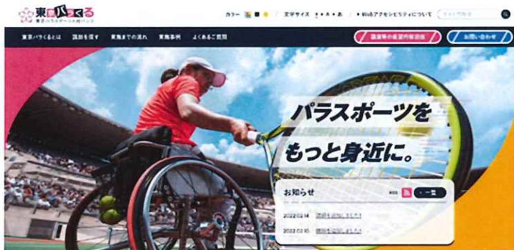
専用ホームページ 『東京パラスポーツ人材バンク 東京パラくる』

区市町村・地域スポーツクラブ・福祉施設・学校・企業等からの依頼を受けて、講演会・体験会やイベント等の講師・ゲストとして東京ゆかりのアスリート・パラスポーツスタッフ・競技団体をマッチングするサイト（東京パラくる）を運営しました。