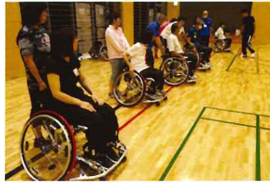
荒川総合スポーツセンター