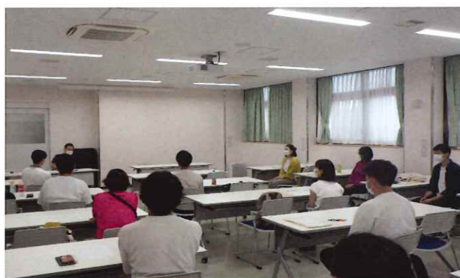
【医療・福祉・教育連携講座】