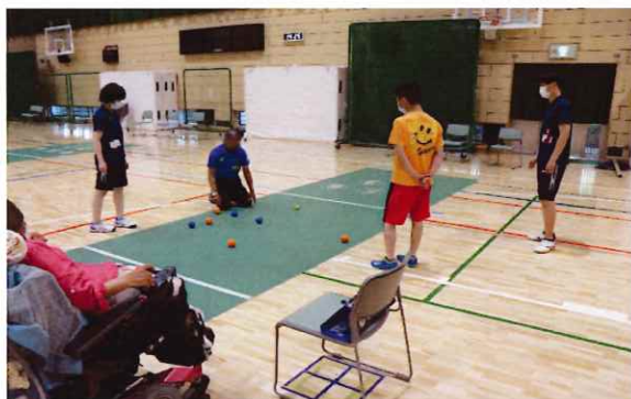
レクリエーション・スポーツ