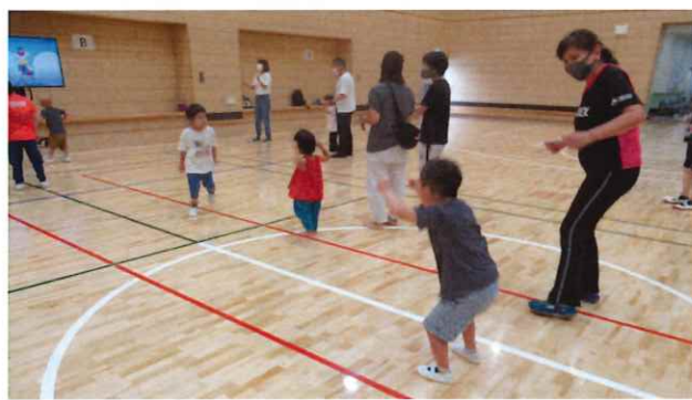
【あつまれジュニア☆ダンス広場】