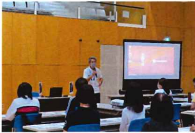
墨田区総合体育館