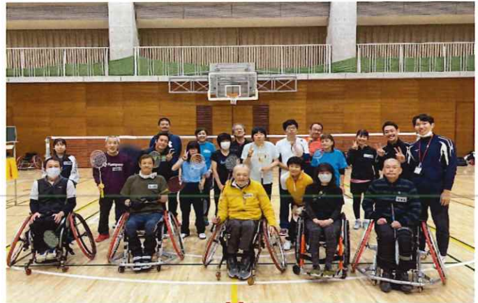
【みんなで交流☆バドミントンin江東区】