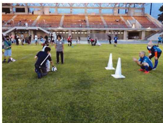
スフィード世田谷 BFC「スフィード大蔵まつり」