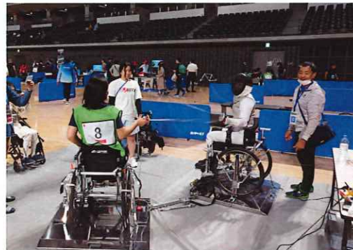
「競技体験会」車いすフェンシング