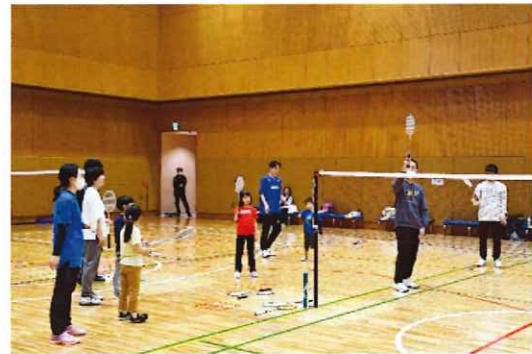
親子でバドミントン