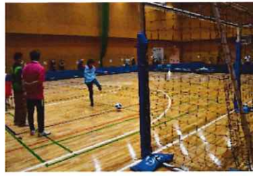
ブラインドフットボール