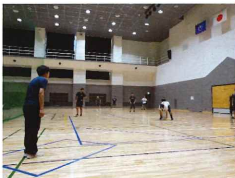
東京都 ID フットソフトボール協会