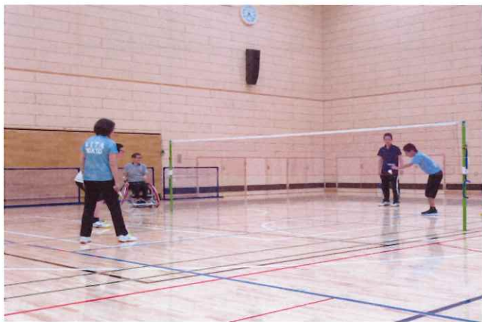
【はじめよう！バドミントン入門】