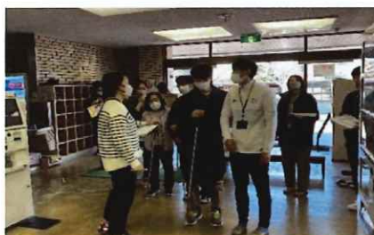
障害当事者による施設検証