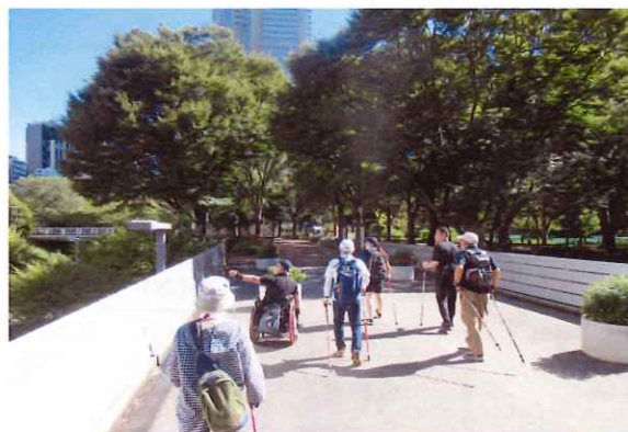
【東京23トコトコ散策ツアー～in新宿区～】