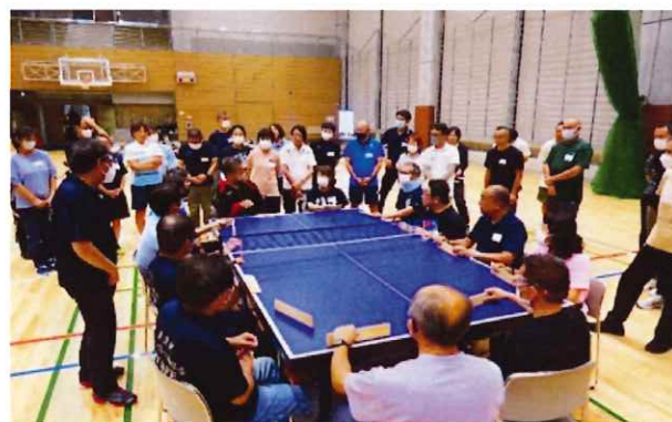
障がいのある人との交流