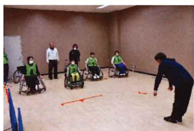
競技用車いすに乗ってみよう