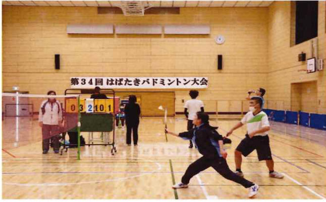
【第34回はばたきバドミントン大会】