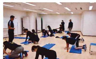
競技力向上プログラム