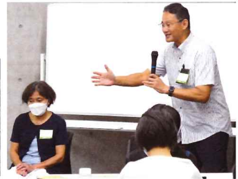
先輩指導員の講義