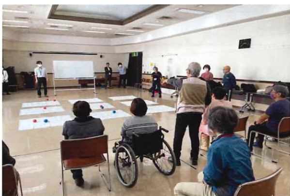
【板橋区障がい者福祉センター】