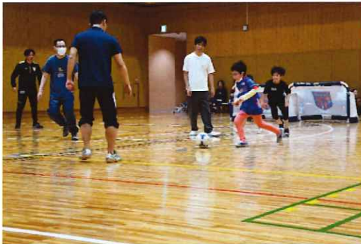
親子でサッカー教室