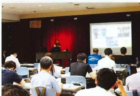
区市町村スポーツ主管課職員対象