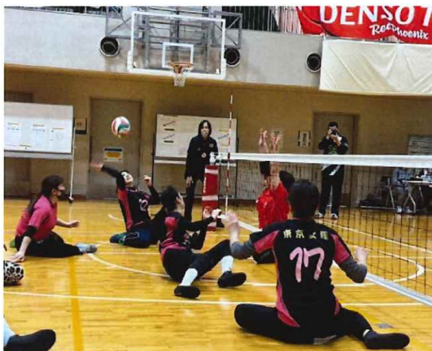
<シットティングバレーボール>