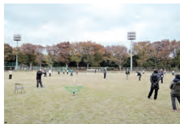
晴天の北区中央公園野球場

平成28年11月26日(土)秋晴れの好天の中、はばたきターゲットバードゴルフ大会を行い、24名の選手が参加されました。