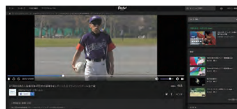
グランドソフトボール競技を実況・解説付きで生中継

1月29日(日)には、武蔵野総合体育館メインアリーナで開催する「第17回東京都障害者スポーツ大会 車椅子バスケットボール競技」を生中継します。是非、TOKYOパラスポーツチャンネルをご覧ください!