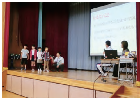
小金井市立小金井第二小学校での様子