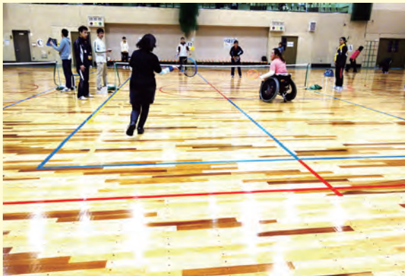
ショートテニスの様子

日頃やってみたいと思ってもなかなかチャレンジできない方、クラブの仲間と一緒に是非この機会にやってみませんか。