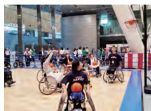
車椅子バスケットボール体験

障害のある人もない人も、みんなでスポーツを楽しむイベント「チャレスポ! TOKYO」が9月20日(日)に東京国際フォーラムで開催されました。車椅子バスケットボールや、ブラインドサッカーなど、競技団体等の協力を得て実施しました。8競技を体験するコーナーを設け、会場には約1万人の方が来場し、スポーツ体験やステージイベントを楽しみました。