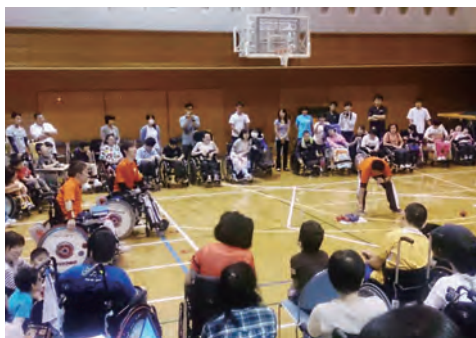
群馬県立あさひ特別支援学校での様子

緯を話していただきました。また、質問をした児童にはメダルを掛けていただいたところ、児童は一樣にその重みに驚きながらも輝くメダルに喜びの表情を見せていました。