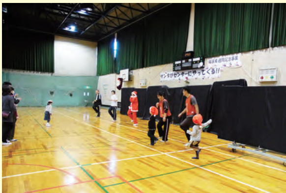
障害者週間記念事業の様子

どなたでも楽しめるイベントが盛りだくさん！家族・友達を誘って、みんなで楽しい時間を過ごしませんか？いろいろなスポーツ体験もできます！