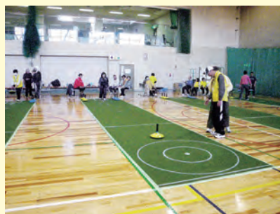
ユニカール体験会の様子

ニュースポーツでもある「ユニカール」を実施します。誰もが気軽に楽しめるスポーツですので、是非参加してみてください。ミニ大会も企画しています。