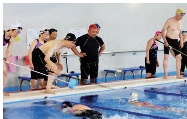
受講者のタッピング

講義では、写真・映像・実際の体験談を交えつつ、視覚障害者への指導法などについての講義が行われました。一方の実技では、何も見えないように加工したゴーグルを使用し、全盲の方の泳ぎの体験やタッピング方法について、実践的な練習が行われました。研修会後には講師へ多くの質問が出るなど、参加者の皆様の熱意が伝わってくる研修会でした。