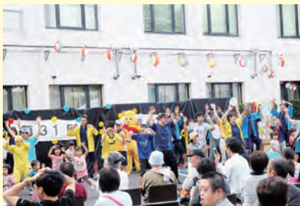
昨年の「日曜広場(盆踊り)」の様子

日曜広場では、様々な障害のある方や家族、介護者、地域の方が一緒にゲームを楽しめます。月ごとに変わるテーマに合わせて工夫しています。