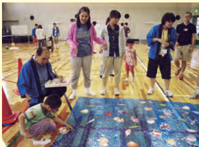
昨年の納涼祭より

今年もセンターの夏祭り、納涼祭を行います！実行委員や利用団体の皆さま、その他多数の方のご協力をいただき、イベント、模擬店、フリーマーケット等いろいろ用意しています。楽しい、夏の思い出をつくりましょう！