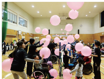
笑顔でアタック風船バレーの様子

平成26年12月23日(火・祝)東京都障害者総合スポーツセンター体育館にてジュニア(高校生以下)を対象にした交流大会が行われました。午前中はルールを少し緩和したボッチャゲームを行い、午後はふうせんバレーを行いました。今年から30秒間で15個ふうせんを打ち合う、笑顔でアタックふうせんバレーという新種目を取り入れました。これは、多くのふうせんを打ち合うゲームでみんな張り切って打っていました。笑顔の多い良い大会となりました。