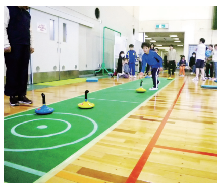
ちびっ子もたくさん参加してくれました!

中心に行いました。子供たちの参加も多く、熱戦・接戦が繰り広げられていました。たくさんの方に参加していただき、笑顔のあふれる大会となりました。