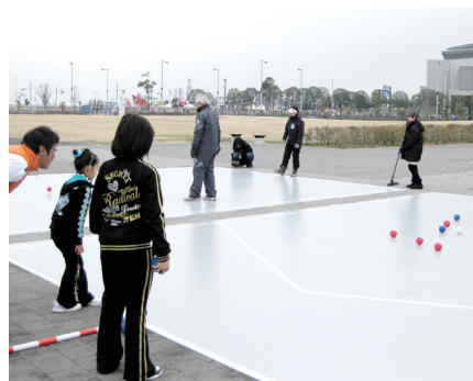
ボッチャは、年齢に関わらず楽しめます

平成27年2月22日(日)、東京マラソンのレースに併せて「東京大マラソン祭り2015」が開催され、当協会事務局では、東京臨海広域防災公園(江東区)にて、車椅子バスケットボール体験、車椅子乗車体験、ボッチャ体験のブース運営を行いました。家族連れの方に大勢来ていただき、障害者スポーツを知っていただく良い機会となりました。