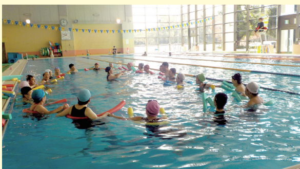
ヌードルビクスの様子