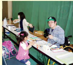
昨年のさくらまつり (似顔絵)