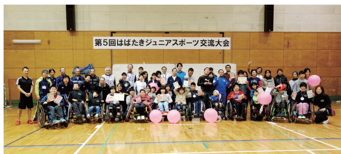
終わって記念写真、楽しい一日でした

平成26年12月23日(火・祝)東京都障害者総合スポーツセンター体育館にてジュニア(高校生以下)を対象にした交流大会が行われました。午前中はルールを少し緩和したボッチャゲームを行い、午後はふうせんバレーを行いました。今年から30秒間で15個ふうせんを打ち合う、笑顔でアタックふうせんバレーという新種目を取り入れました。これは、多くのふうせんを打ち合うゲームでみんな張り切って打っていました。笑顔の多い良い大会となりました。