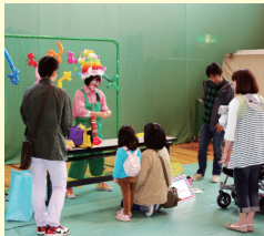
昨年のさくらまつり (バルーンアート)