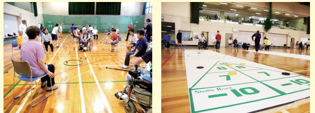
レクリエーション教室