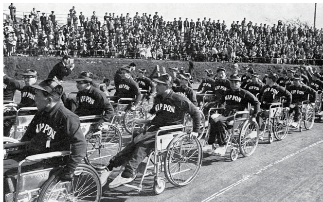
東京大会の日本選手入場行進の様子です

そして、パラリンピックという名称が正式名称になったのは1988年のソウル大会以降からです。