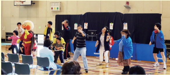
昨年のさくらまつりダンス