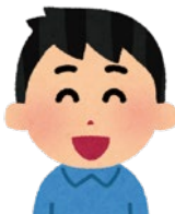
ボランティア コーディネーター

S&Sを活用したボランティアの募集や当日までのコミュニケーションなど、ボランティア・マネジメントの方法をアドバイス