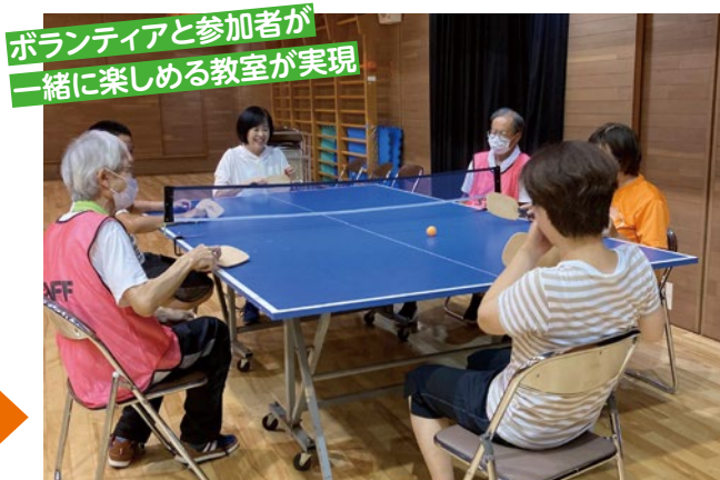
ボランティアと参加者が一緒に楽しめる教室が実現

S&Sを活用したボランティアの募集や当日までのコミュニケーションなど、ボランティア・マネジメントの方法をアドバイス