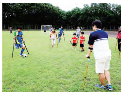
スポーツ体験の様子