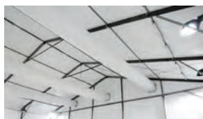
◀ テント製の練習会場(空調の音が響く)