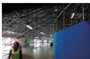
◀ フューチャーアリーナ裏(8000席は仮設スタンド)

報道でリオ2016パラリンピック組織委員会が財政難など報じられていたとおり、コストを抑えた開催運営が手に取るよう分かりました。その反面、選手にとって良い環境か、構造的に安全なのか、といった部分も多々あったのも事実です。ゴールボール会場では、試合中に巡回していたメディカルスタッフが、鉄板製の階段から滑り落ちるということがありました。