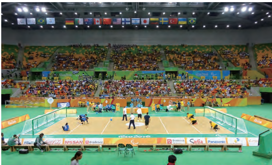
◀ ゴールボール会場(フューチャー・アリーナ)

ゴールボール会場のフューチャー・アリーナは、客席12,000、車いす席92、介護者同伴席8、盲導犬席2を備えた大変立派な会場で、休日の試合となると9割の席が埋まり大変盛り上がりしました。