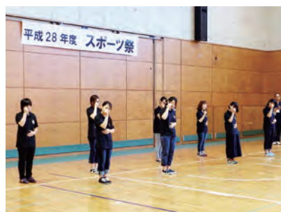
手話ダンスの様子

8月28日(日)、東京都障害者総合スポーツセンターと北区中央公園野球場にて、障害者スポーツについて「知る」「観る」「触れる(体験)」をテーマとして、北区と共催で「スポーツ祭」を実施しました。この事業では板橋区主催のジュニアトライアスロン大会(障害者クラスも実施)も並行して行われました。北区が行ったスケート体験の他、アンプティサッカーや車いすバスケットボールなどの障害者スポーツ体験も行われ、約1000名にご参加いただきました。