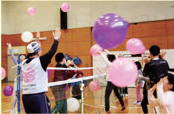
昨年の大会の様子です。

こどもたちを対象としたスポーツ交流大会です。競技種目は、風船バレーとボッチャです。多くのチームの大会への参加をお待ちしています。