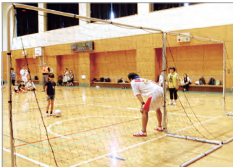
『みんなでブラインドサッカー』(総合SC)の様子

みんなで〇〇教室は、障害のある方だけでなく、そのご家族やご友人、地域の方々など、障害の有無にかかわらずどなたでもご参加いただける教室です。バドミントンやテニス、卓球など、様々なスポーツの教室があります。今年度からはボッチャ、ブラインドサッカーも新たに加わりました！