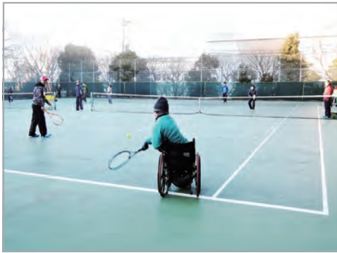
『みんなでテニス』(総合SC)の様子