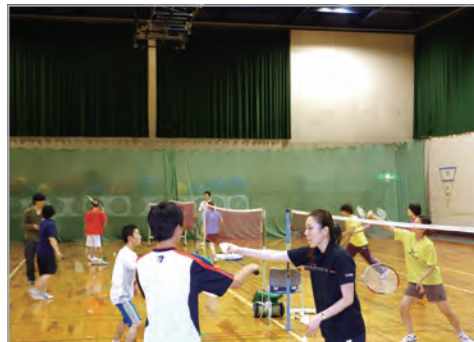
『みんなでバドミントン』(多摩SC)の様子